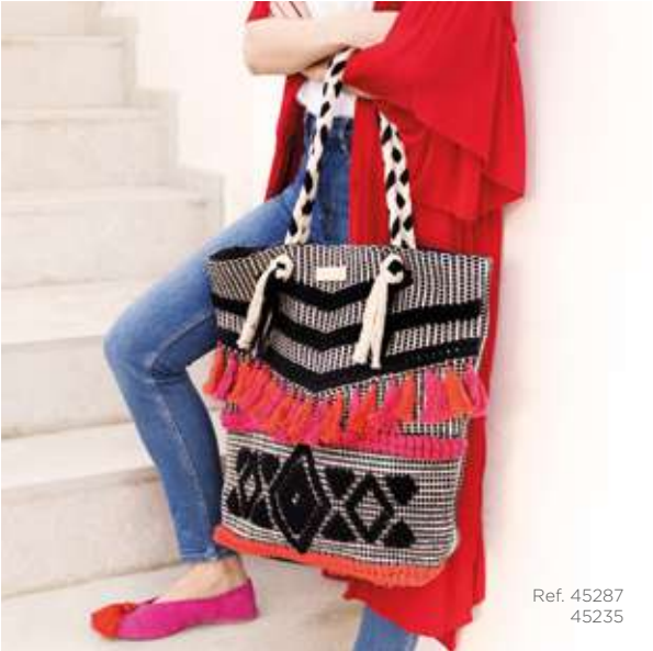
Ref. 45287 45235