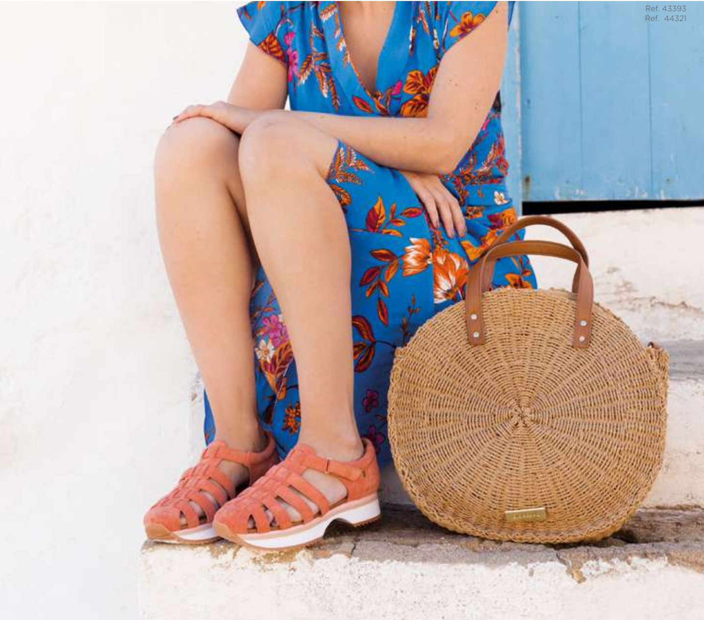
Ref. 43393 Ref. 44321