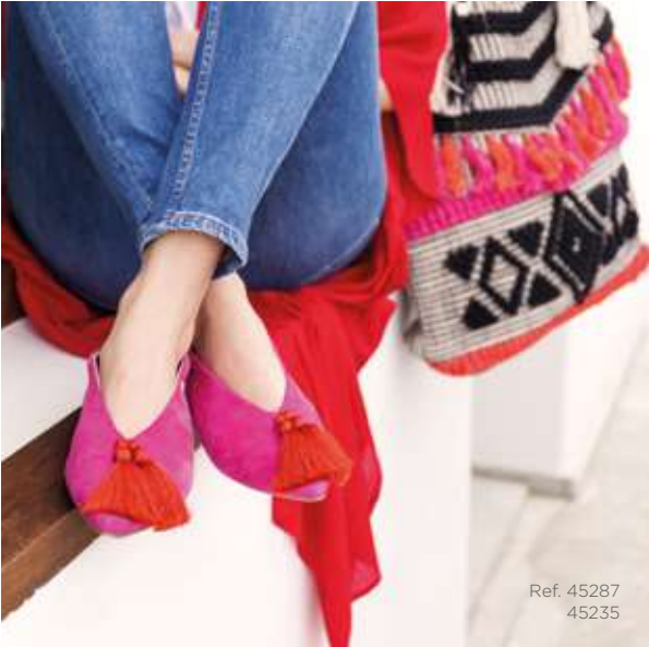
Ref. 45287 45235